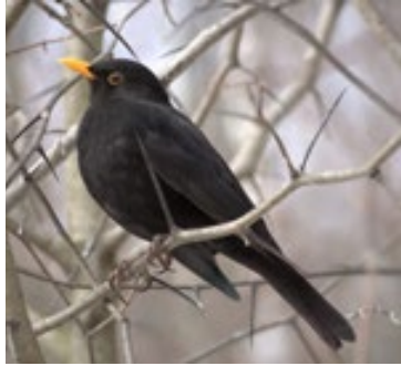
Merle noir mâle

Turdus merula est le merle noir, volatile fréquent dans nos jardins, squares et autres lieux de verdure. Cependant, comme la plupart des animaux que notre regard croise machinalement, ses comportements et son mode de vie sont souvent méconnus et, pourtant, ils peuvent être tout aussi passionnants que le chant des baleines, la nidification des cigognes ou le panda croqueur de bambou ! Heureusement, les éthologues sont là pour nous éclairer !