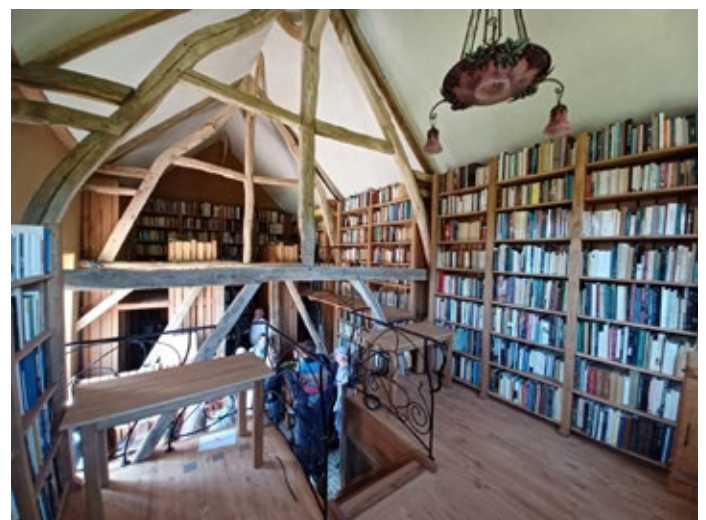
Vue de l'intérieur de la bibliothèque en juin 2023