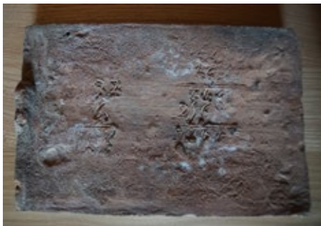
Tuile comportant un décompte de tuiles ou de briques. Elle fut trouvée à Ons-en-Bray. Ces tuiles sont marquées alors que l'argile est encore souple et donc juste après leur fabrication et avant séchage et cuisson.

où vont circuler les lourds chariots apportant l'argile et remportant les briques et les tuiles. Une couche de petits silex est alors posée sur le passage jusqu'à l'intérieur de la grange, mais les chariots sont toutefois si lourds, qu'ils laissent derrière eux deux belles ornières, encore visibles aujourd'hui. La grange va ainsi abriter l'argile pendant au moins cent-cinquante ans. Les briques et tuiles produites vont sécher dans la cour de la ferme et les animaux ne vont pas pouvoir s'empêcher de marcher dessus laissant leurs empreintes pour la postérité. Mais ce ne sont pas les seuls : les arbres y posent leurs feuilles qui doucement s'enfoncent décorant ainsi les tuiles. Tuiles et briques sèches sont alors, soit cuites sur place dans les talus (donnant des briques orangées et fragiles) soit envoyées via des charretiers vers des fours pour une cuisson de meilleure qualité. Mais avant de les expédier il faut savoir combien ont été produites. Alors, on les dénombre sur une tuile d'argile meuble qui n'a pas encore séché et, parfois, on signe !