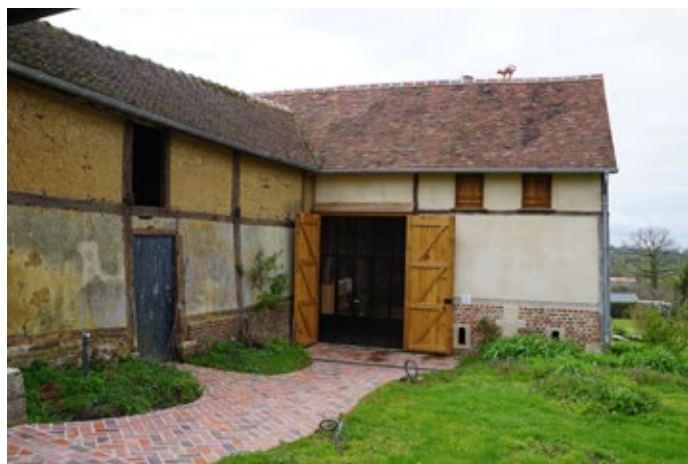
Vue de l'entrée de la bibliothèque en avril 2023 (bâtiment du XVIIe siècle). Les travaux d'aménagement sont en cours de finalisation. (photographies S. Peineau)

Mais revenons à la naissance de notre grange. Louis XIII règne sur le royaume de France. Les agriculteurs de cette première moitié du XVIIe siècle, installés dans la seigneurie des comtes de Troussures, vivent à proximité du château situé sur l'ancienne motte féodale. Les temps changent. Il faut diversifier les activités pour répondre aux besoins de leurs concitoyens. Il faut des tuiles et des briques. Le terrain est propice car il est constitué d'épaisses couches d'argile quasiment affleurantes. La matière première est facile à extraire mais les terrains sont gorgés d'eau et le climat pluvieux, donc il faut un endroit au sec pour stocker l'argile avant de la travailler. Le haut de la colline paraît idéal. Les soubassements en silex sont montés et la grange est bâtie en pan de bois. Les murs sont en torchis sur lattes et la toiture est de chaume (de blé très certainement). L'entrée donne directement sur la place haute du village. Mais la terre du sol est meuble dans le secteur et il faut renforcer les espaces