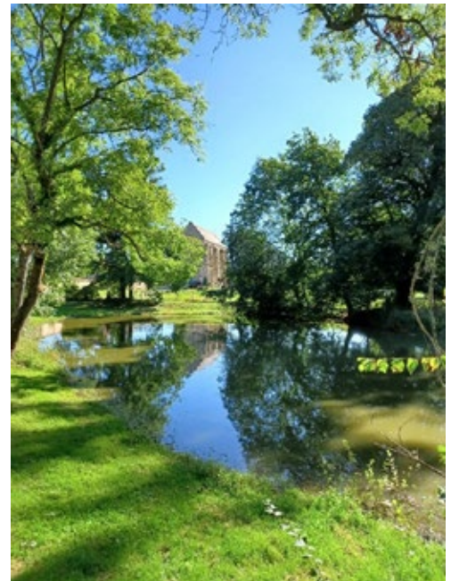
Un cadre superbe, sous le soleil du 15 août 2021 !

*La distance à vol d'oiseau de l'Abbaye de Marcheroux à l'Eglise de Valdampierre est de 1,7km. Merci à mon ami G. ** Appellation ancienne des nonnes