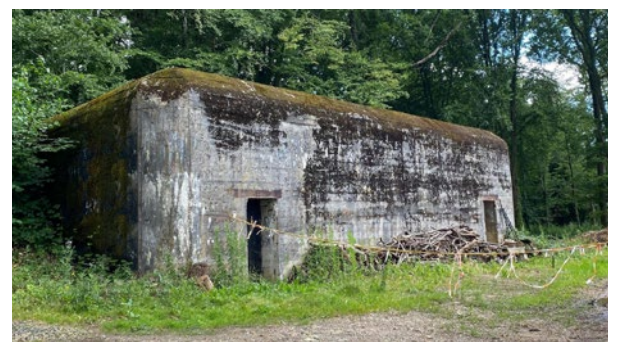
Entrée supposée du bunker de commandement