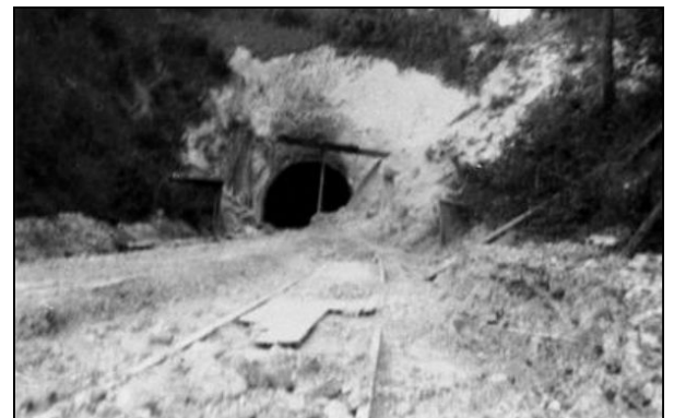
Entrée du Tunnel après un bombardement de la R.A.F.