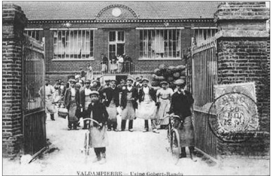
Actuelle place devant l'école de la marbrerie

Les unions syndicales ouvrières locales ont vent de cette entente patronale et la grève débute le 3 mars 1909 dans l'usine Schindler d'Andeville, dès l'annonce des nouveaux tarifs salariaux. Ce mouvement fait tache d'huile et, en une dizaine de jours, tout le « Pays de Nacre » est en grève. La situation s'envenime jusqu'à la fin mars et toutes les négociations échouent. Bien entendu, les gendarmes sont présents partout où manifestent les grévistes (au nombre de plusieurs milliers) mais cela n'empêche pas les débordements et les violences de part et d'autre (patrons rossés et humiliés, manifestants grièvement blessés lors de charges de gendarmes à cheval). La grève perdure et les autorités préfectorales font appel à l'armée (escadrons de dragons et hussards) et obligent toutes les parties à négocier. Un accord patron-ouvriers est signé le 31 mars, mais les huit plus gros fabricants déclenchent aussitôt une « guerre d'usure » en décidant de fermer leurs usines pour « démoraliser » les ouvriers, désormais au chômage et ruinés, et les obliger à accepter des baisses de salaire pour retrouver leurs emplois. Tout ceci conduit à la reprise des actions violentes le 9 avril ! Dans tous les villages en grève, la troupe charge, faisant des blessés, et les gendarmes arrêtent les « meneurs ». Deux généraux, Nicolas et Joffre (futur acteur majeur de la première guerre mondiale) sont dépêchés sur place à la demande du préfet de l'Oise. Les grèves, manifestations violentes et répressions