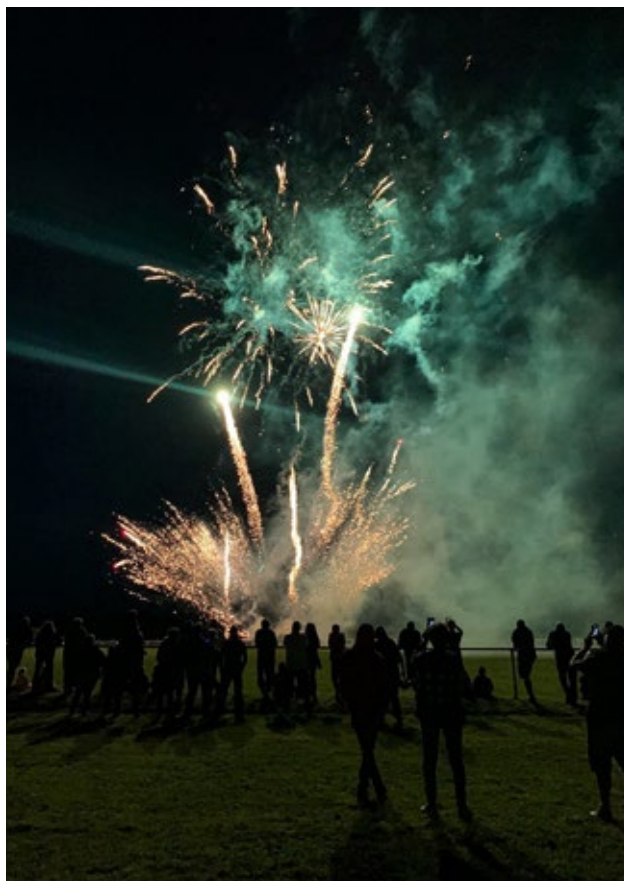
Feu d'artifice au Stade des Marettes, le 17 juillet 2021