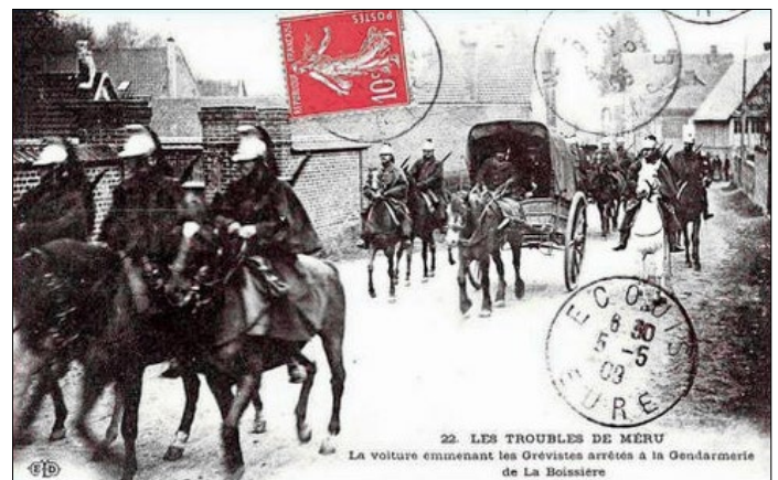
22. LES TROUBLES DE MÉRUC La voiture emmenant les Grévistes arrêtés à la Gendarmerie de La Boissière