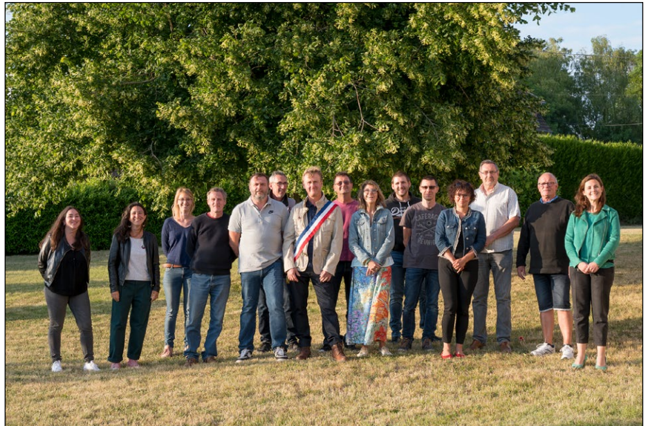
La nouvelle équipe municipale

La conclusion des études pour la mise en ligne du site Internet de Valdampierre est en cours et il sera opérationnel avant la fin de l'année, ce qui vous permettra d'y trouver et retrouver toutes les informations sur la vie de notre commune, tant administratives et pratiques que culturelles et évènementielles.